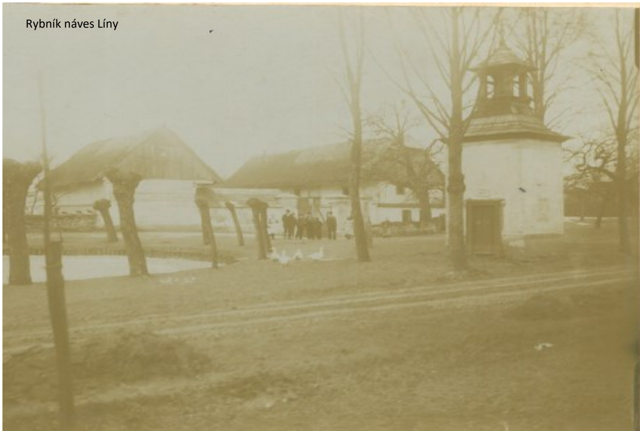
Rybník návěs Líny

hry platilo nepsané pravidlo holčičky bruslily u Pavlíčků a kluci hráli hokej na Podvodníku, ale samozřejmě si na obou rybnících hrály všechny děti. Další vodní plochy byly na každém větším dvoře, voda se využívala pro dobytek a drůbež. Napočítali jsme jich nejméně dalších šest. Voda do nich stékala ze střech a při tání sněhu. Ptala jsem se, kde brali vodu lidé pro sebe na pití, vaření a praní. Tak taky ze střech, kdy dešťová voda stékala do studní a ta se pak převažovala, nebo se chodilo do studánek anebo se jezdilo voznicemi do Jizery. Když se v roce 1910 postavil vodovod, neznamenalo to, že měli vodu doma v kuchyni, ale po vsi byly litinové pumpy, které byly připojeny na řád. Některé rybníčky byly zasypány, jiné vyschly, a tak už zůstaly jen dva, ten na návsi a jeden je u Kašpárků na zahradě.