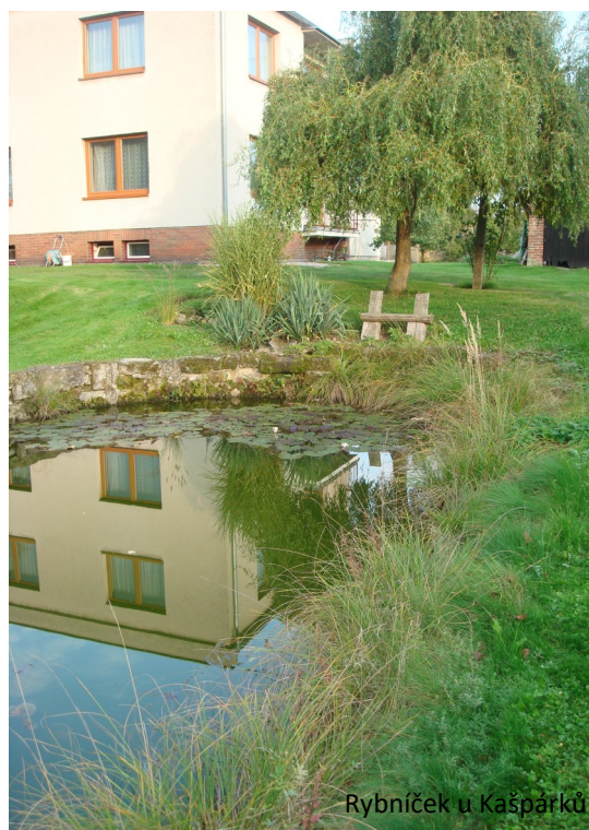
Rybníček u Kašpárků

O bukovenských vodních plochách nemám bohužel žádné informace a ani v kronice nejsou konkrétní záznamy. Vodní plocha nám zůstala už jen jedna na návsi. Druhá nádrž, na které se také bruslilo, vyschla. Na povídání o bukovenské vodě přišli tři občané. Jedna z vodních ploch byla před Brožkovými, určitě byly také u větších staveních jako v Línech. A protože v domech na návsi je spodní voda, byly a někde ještě jsou ve sklepeních studánky.