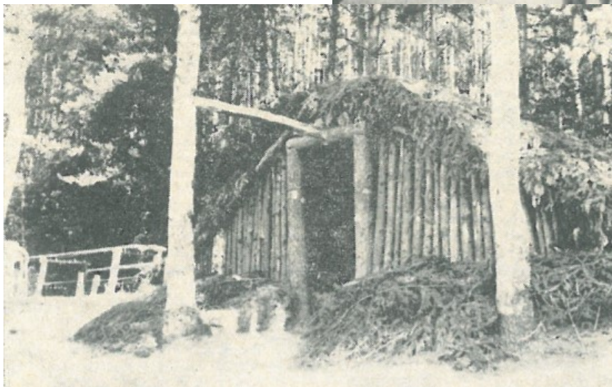
Výpis z kroniky rok 1945 Leden-květen